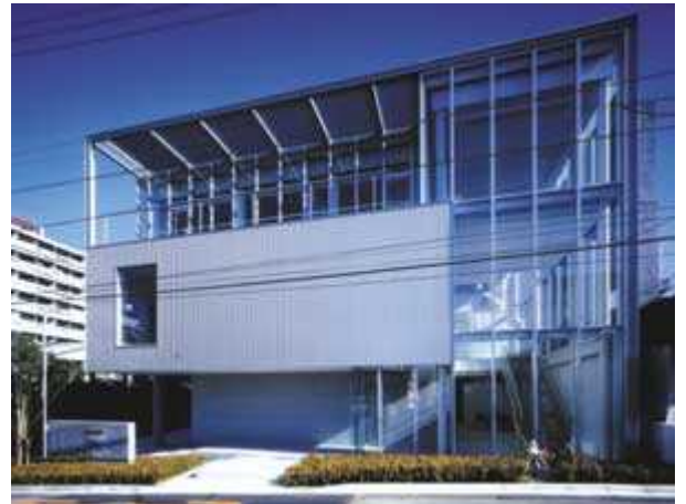
週刊つりニュース東京本社ビル