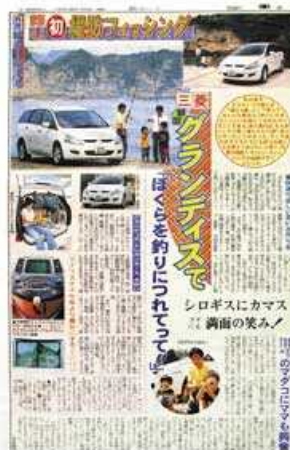
中面カラー記事広告(11段)