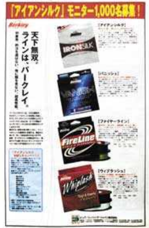
中面カラー全面広告(11段)