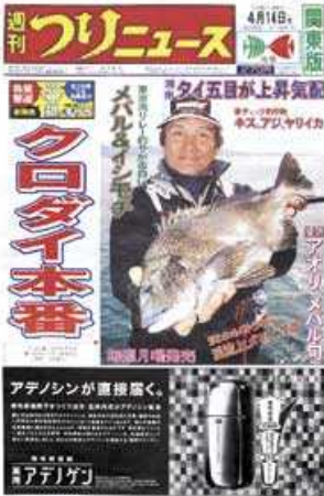
表1全3段カラー広告