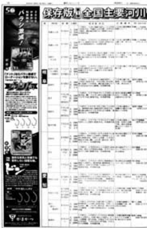
モノクロエントツ広告